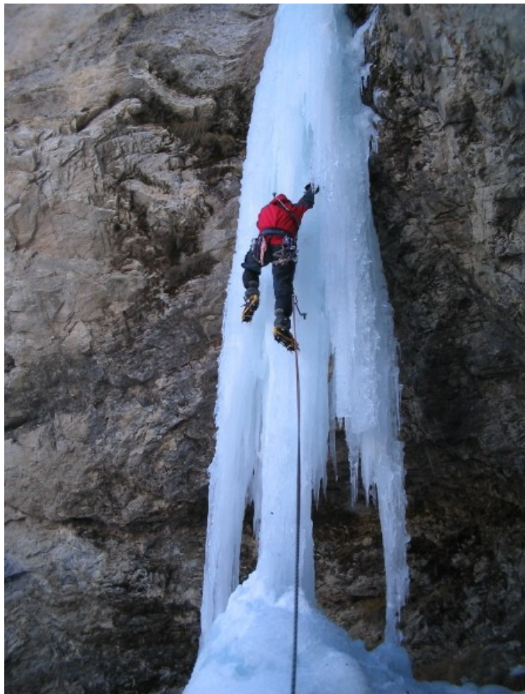
La candela nel 2006

Commenti personali: esile candela, suggestiva e piuttosto impegnativa. Controllare che la base sia abbastanza solida.