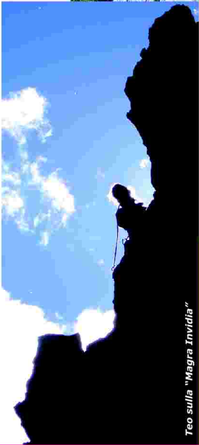
Teo sulla "Magra Invidia"