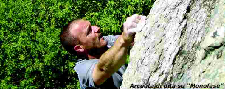
Arcuata di dita su "Monofase"